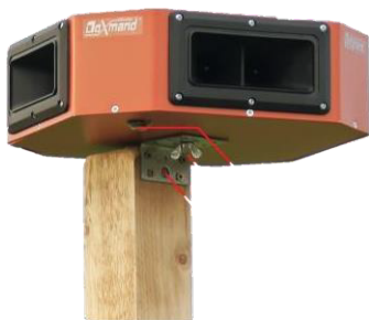
Fixation et alimentation

Étape 1 : Fixation du support au poteau au sol.